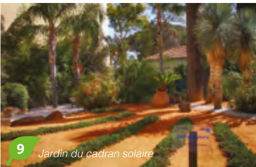
9 Jardin du cadran solaire