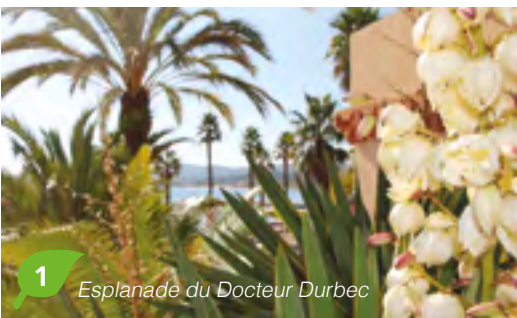
1 Esplanade du Docteur Durbec