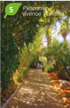
5 Piétonnier, avenue V. Auriol