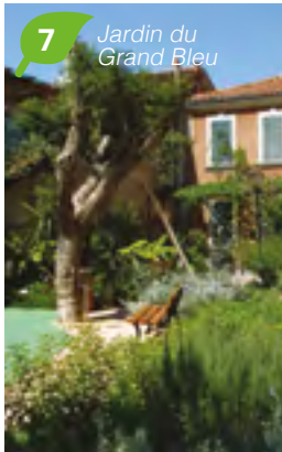
7 Jardin du Grand Bleu