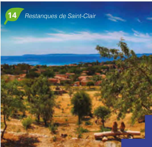
14 Restanques de Saint-Clair