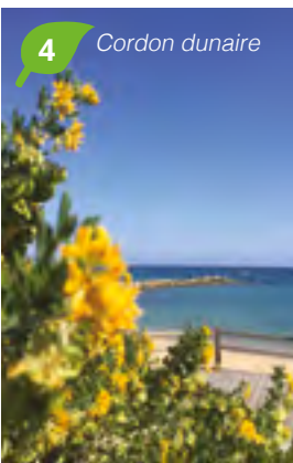
4 Cordon dunaire