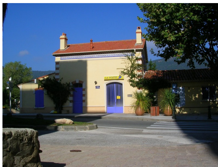
Le bureau de poste de Cavalière