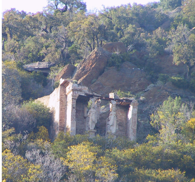
Le Temple d'Hercule