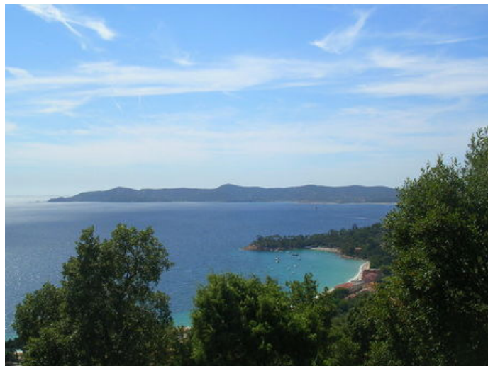
Vue sur le Layet