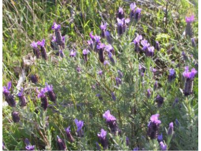
Lavande des Maures

Les Maures, qui signifient « bois noirs », vous invitent cependant au cœur d'un massif verdoyant et coloré.