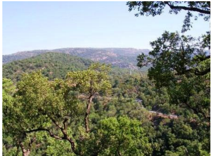
Le Massif des maures

Les Maures, qui signifient « bois noirs », vous invitent cependant au cœur d'un massif verdoyant et coloré.