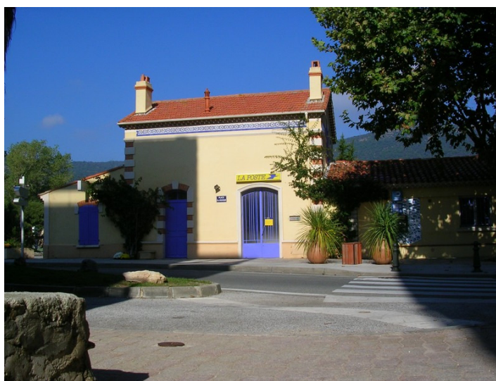
Le bureau de poste de Cavalière