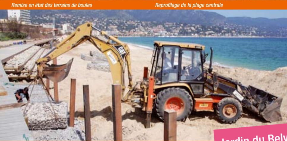
Plage de l'Anglade, pose de gabions pour lutter contre l'érosion