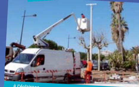
... à l'éclairage...

Le réaménagement du quai Baptistin Pins vient de s'achever avec, en son axe central, une superbe rose des vents de Provence, composée de 150 pièces de granit sur un diamètre total de 12 mètres. Pour valoriser ce nouveau lieu de promenade - en continuité du centre-ville - tout un éclairage au sol et sur des mâts complète harmonieusement l'ensemble. Mise en lumière le 6 mai 2011 au soir!