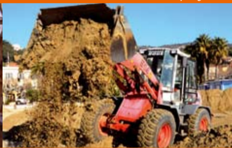
Reprofilage de la plage centrale