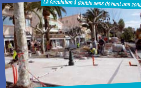
... sur plusieurs mois...