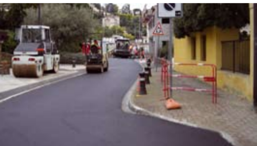
La rue du Général de Gaulle goudronnée sur sa dernière partie

Avec la période estivale en point de mire et, dans un renouvellement constant d'aménagements ou de réhabilitations, les camions et engins ont, à nouveau, reprofilé la plage centrale en transférant le sable. Du côté de l'Anglade les bulldozers ont poursuivi la restauration de la promenade en planches ainsi que celle de la dune avec la pose de gabions destinés à canaliser l'érosion. La 1 re tranche d'agrandissement du cimetière se termine, les terrains de boules sont réhabilités, la rue du Général de Gaulle est goudronnée, la sécurité sur le sentier du littoral jusqu'au Cap Nègre est assurée. Mais, encore... Tout au long des mois d'automne et d'hiver, en divers lieux de la commune, les chantiers n'ont pas manqué de s'enchaîner, sous la direction des services techniques et des espaces verts. Ces derniers offrant aussi au regard des visiteurs la beauté d'un fleurissement récompensé par le label national « 3 fleurs ».