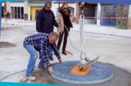
... aux premiers éléments de la rose des vents...