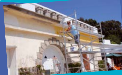
... au dernier coup de pinceau...