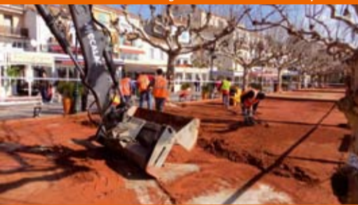
Remise en état des terrains de boules