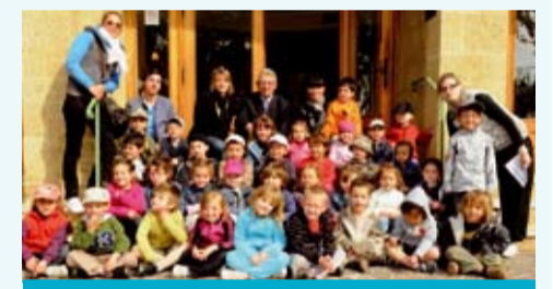
Un petit détour par la mairie dans une course-rébus pour les pitchouns du centre de loisirs

Hors des horaires traditionnels de scolarité, voilà un service qui remporte l'unanimité auprès des familles : celui du péri-scolaire et du centre de loisirs. Les activités y sont multiples et choisies pour un plaisir partagé entre animateurs et enfants du Lavandou.