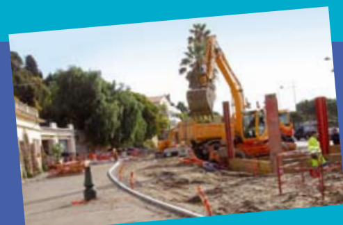
Un vaste chantier...