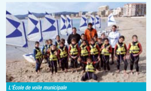
L'École de voile municipale

Dans le cadre des diverses et nombreuses disciplines dispensées par l'École d'Initiation aux Sports (EIS) - qui fête ses 15 ans - en une période où le sport, côté mer, n'est pas au programme, les jeunes lavandourains ont eu la possibilité d'apprendre la natation dans la piscine de l'Hôtel de Cavalière mis aimablement à disposition. Et, dès le printemps, c'est l'initiation à la voile avec l'École municipale qui a repris. Les adolescents peuvent aussi bénéficier de la structure « Lavandou Espace Jeunes ». Le programme des animations, conçu par le service des sports, y est particulièrement éclectique. Après les séjours au Futuroscope fin avril, prochaines sorties avant les vacances : 22 mai : journée pêche et voile. 4 juin : journée rando, repas champêtre et cinéma. 18 et 19 juin : raid aventure. 25 juin : Aqualand. 29 juin : soirée de fin d'année avant le 1 er juillet une matinée nautique à Cavalière.