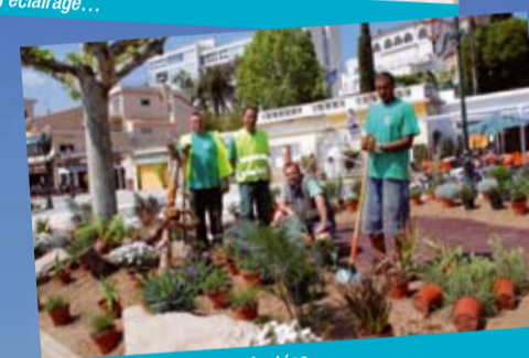
... aux dernières fleurs plantées.