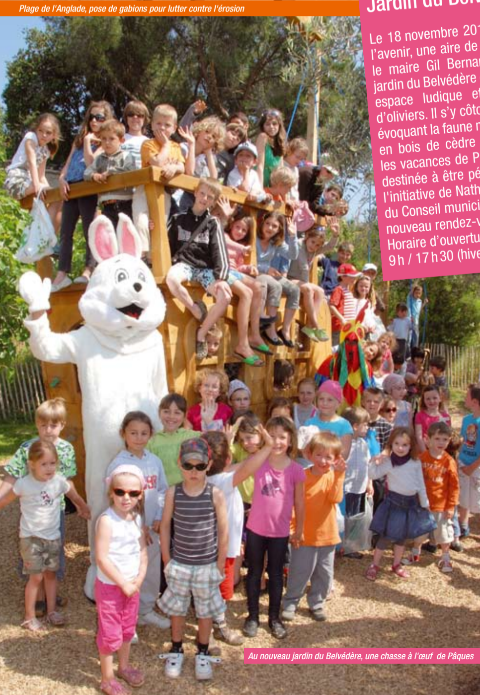
Au nouveau jardin du Belvédère, une chasse à l'œuf de Pâques