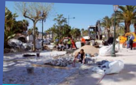
... du pavage...