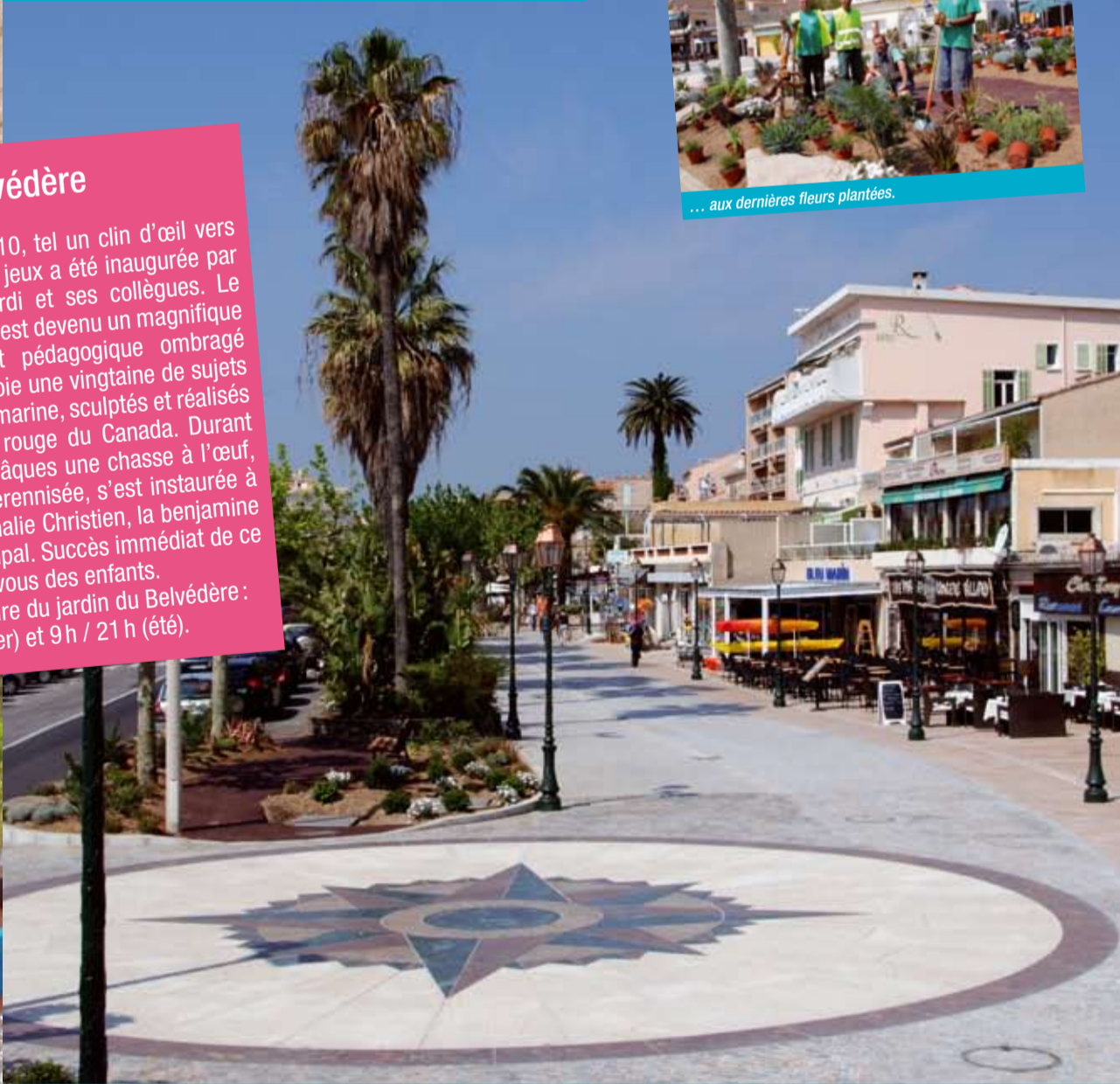
Un nouveau quai Baptistin Pins avec une rose des vents déjà très admirée