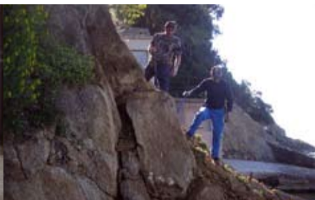
Mise en sécurité du sentier du littoral vers le Cap Nègre