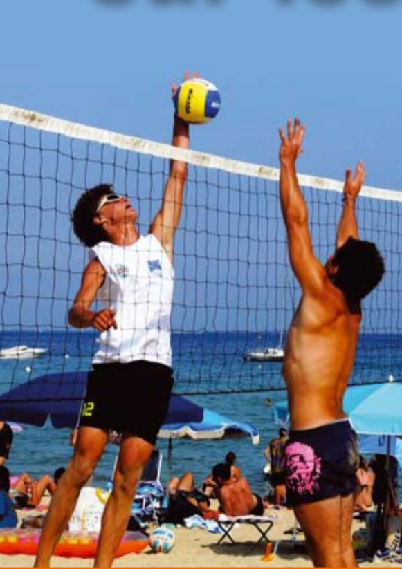
Beach volley et tournées estivales sur le sable...

en géotextile destiné à piéger le sable ». D'autres exemples ont été apportés par les représentants d'Hyères, La Seyne sur-Mer, Saint-Cyr, Carqueiranne ainsi que par la Vice-Présidente du Conseil Régional. Il faut donc agir vite pour préserver le potentiel balnéaire et, par voie de conséquence, l'économie locale de stations balnéaires. « Il n'est pas trop tard! ».