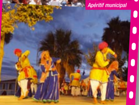
Festival de folklore