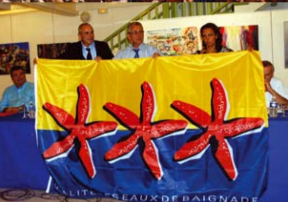
Le président du SCLV remet le fanion "Étoiles de mer" au Préfet du Var. Label accordé aux plages du littoral pour la qualité des eaux de baignade