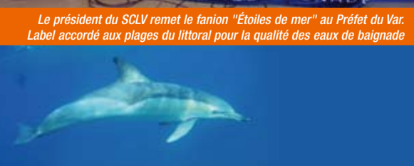
Cet été dans le port, un dauphin est venu saluer Le Lavandou! Les CRS ont mémorisé cette visite...