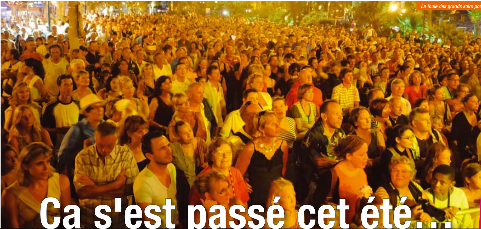
La foule des grands soirs pour...