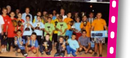
La découverte de jeunes formations