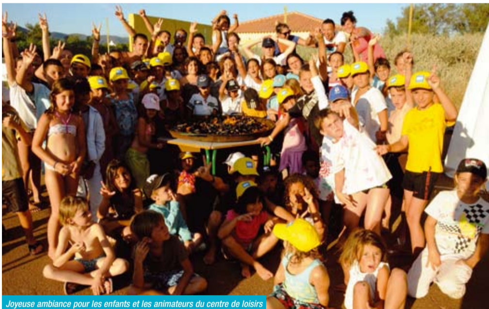
Joyeuse ambiance pour les enfants et les animateurs du centre de loisirs

« spot-plate » de l'Anglade les joies de la baignade, des jeux d'eau, de la voile avec l'école municipale, du camping complètent l'ensemble des animations prévues. Cette année, pour clôturer ces agréables moments de joie et de bonne humeur entre copains, cerise sur le gâteau des loisirs : une « boum » nocturne où chacun s'est « éclaté » avant de reprendre le chemin de l'école ou du