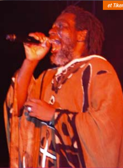
et Tiken Jah Fakoly