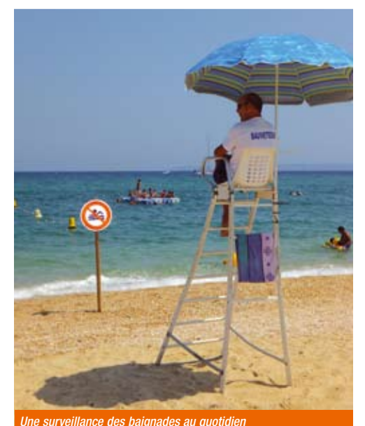
Une surveillance des baignades au quotidien